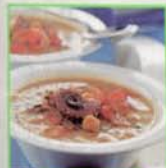
Con i ceci

Cucina Le zuppe di pesce dell'inverno pag. 206